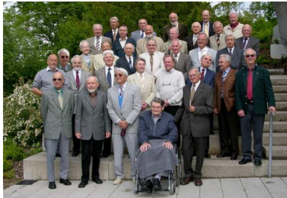
55-jähriges Absolvententreffen des Brukenthalgymnasiums - Hermannstadt - in Tübingen/Schw.Alb vom 16.-18. Mai 2011

Es geht um das Klassentreffen mit den einstigen Schulfreunden aus Hermannstadt. Mit ihnen hatten wir uns schon einige Male getroffen. Wir hatten in Hermannstadt das 5-jährige, das 10-jährige und das 15-jährige Jubiläum gefeiert. Das 20-jährige und das 25-jährige wurden hier in Deutschland in verschiedenen Orten gefeiert. Das 50-jährige, 53-jährige und 55-jährige wurden in Tübingen, wo die evangelische Akademie eine Tagungsstätte besitzt und wo ein Klassenkollege von uns arbeitet, gefeiert.