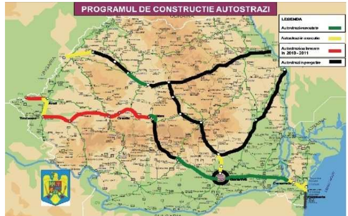
Autobahnnetz Rumänien

Gelb markiert sind die Abschnitte, die sich aktuell im Bau befinden (der Abschnitt Deva – Broos ist noch nicht berücksichtigt), Rot sind die neu beauftragten Abschnitte.