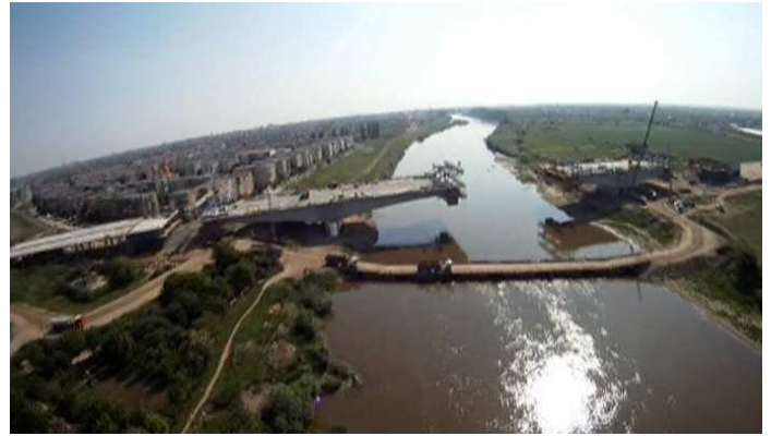
Autobahnbrücke über den Mieresch bei Arad

Auf dem Weg nach Urwegen fängt ab Mako der, im wahrsten Sinne des Wortes, aufregende Teil der Reise an. Hier verlässt man nämlich die Autobahn und reiht sich in den Konvoi der Rumänienreisenden Richtung Nadlac --> Arad --> Hermannstadt ein.