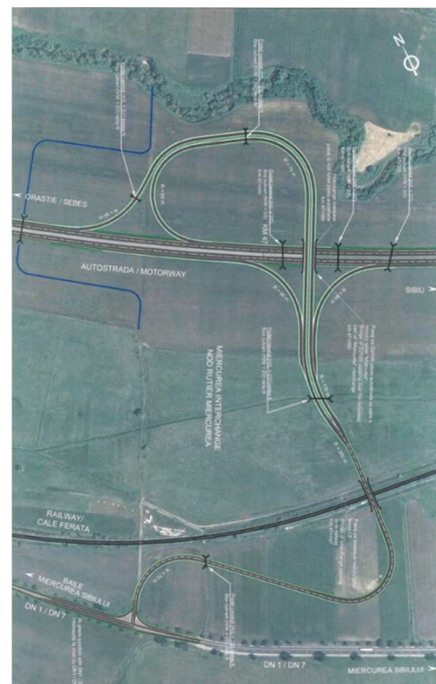
Detailansicht Ausfahrt Reußmarkt

Die obigen Informationen sind alle der (meist rumänischen) Presse und den Internetseiten des CNADR entnommen und entsprechen dem Stand Anfang September 2011.